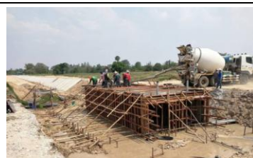
งาน ทาบ.ปากคลองส่งน้ำสาย 1R-LMC