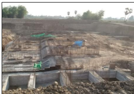
งานคอนกรีตประตุระบายน้ำ