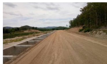
งานรางระบายน้ำ คสล. แบบ U-SHAPE