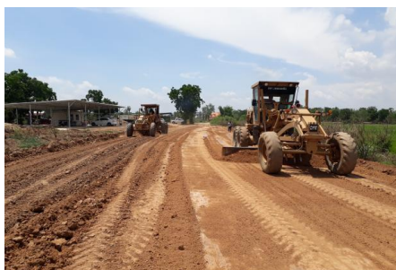
งานก่อสร้างถนนทดแทน