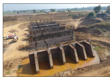
งานประตุระบายน้ำ