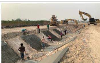
งานตาดคอนกรีตคลองส่งน้ำ (1R-RMC)