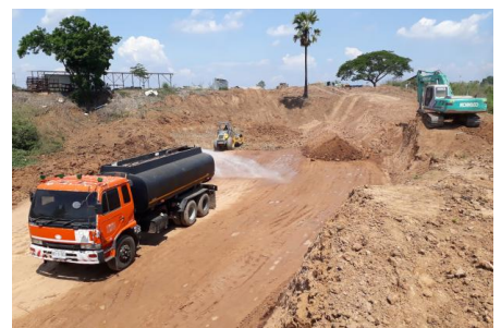
งานดินถมบดอัดแน่นด้วยเครื่องจักรคันประตูระบายน้ำ