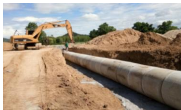
งานท่อลอดคลองส่งน้ำชนิดท่อกลม