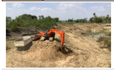
งานขุดดินด้วยเครื่องจักร (ท้ายฝายดั่งสูง)