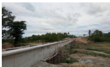
งานสะพานน้ำ