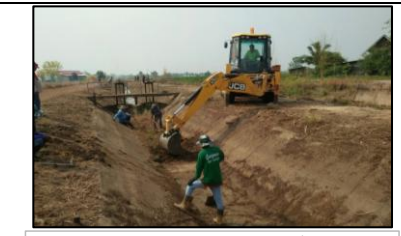
งานขุดลอกตะกอนคลองส่งน้ำ