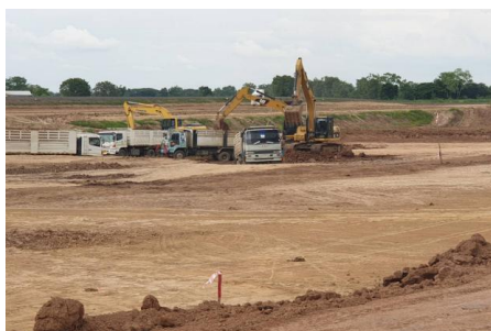
งานขุดบ่อก่อสร้าง (ประตูระบายน้ำ)