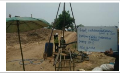
งานเจาะทดสอบดินฐานรากสะพานรถยนต์