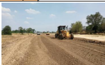
งานดินถมบดอัดแน่นด้วยเครื่อง (1R-LMC)

แผนการแก้ไขปัญหา - ช่วงต้นเดือน ก.พ.62 ถึง พ.ค.62 คณะกรรมการตรวจการจ้างสามารถส่งมอบพื้นที่คลองส่งน้ำต่อเนื่องเพิ่มประมาณ 20 กม. รวมของเดิมเป็น 50 กม. จากทั้งหมด 113.794 กม. ส่วนที่เหลือจะเร่งรัดส่งมอบโดยเร็วต่อไป